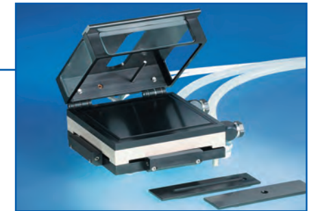
Термокамера TFC 100