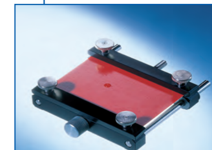
FSC 80 Фиксатор тонких плёнок