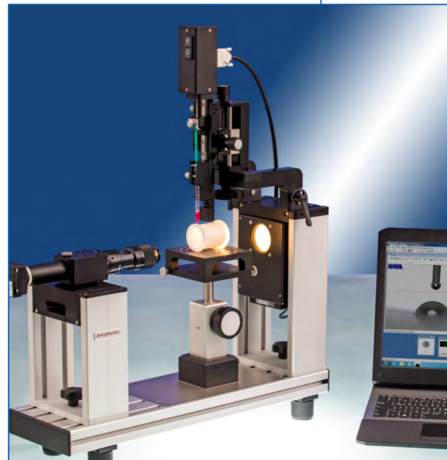
OCA 15EC Package 1 с модулем SD-DM, ESr-D, SCA 20 и SCA 21