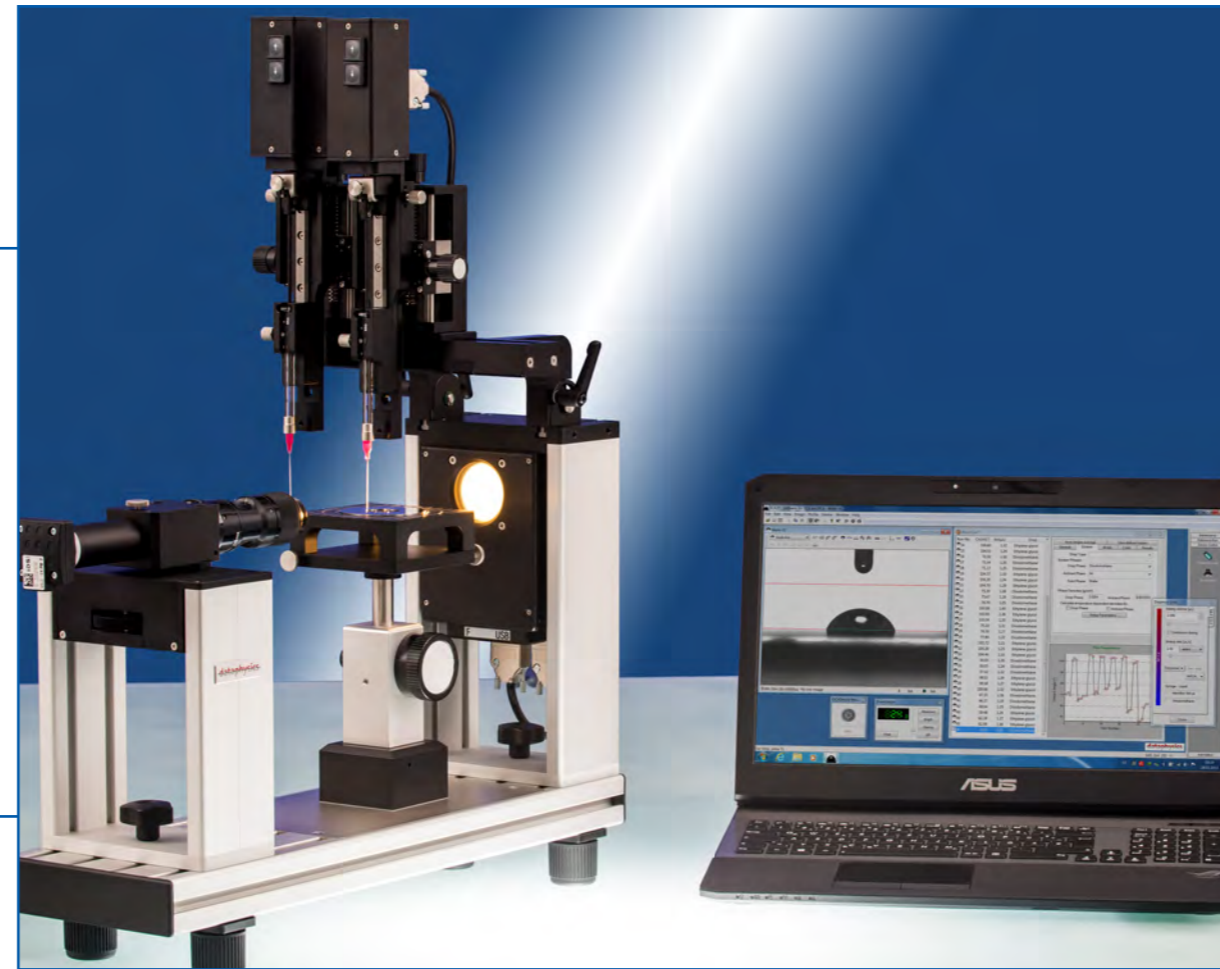
OCA 15EC Package 2 с модулем DD-DM, 2 ESr-D, SCA 20 и SCA 21

Для более удобной транспортировки прибор OCA 15EC может быть разобран и упакован в специально для него созданный чемодан TBO, который не входит в вышеуказанные комплекты.